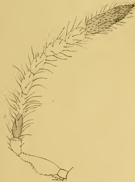
Fig. 4.ª—Antena de Schedioides formosus ♂ (muy aumentada).